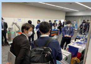
熱心な説明に聞き入る