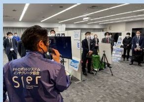
開会のあいさつ (朝礼)

協会にて年2～3回発行している会報誌「JARSIA」へ出展製品情報を広告サイズで掲載します。広告料は出展料に含まれます。また製品情報の「フラッシュ動画」は協会ホームページで公開し、また当日配布チラシにも閲覧QRコードを掲載、いつでも閲覧可能としています。