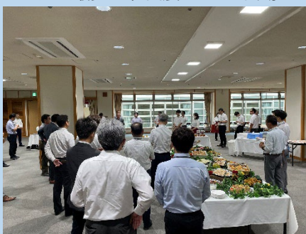
終了後交流会にも多くの方が参加