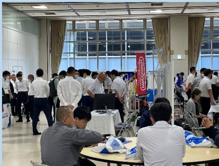
過去最多32社出展 にぎわう会場