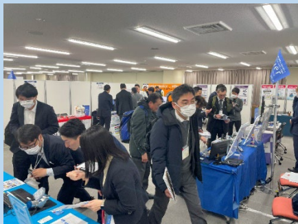
東京会場 出展者31社の様子