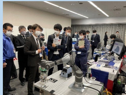
熱心に製品の説明を受ける様子