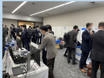
出展ブースへ立ち寄る来場者