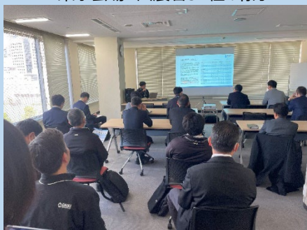
東京会場のプレゼンテーションルーム